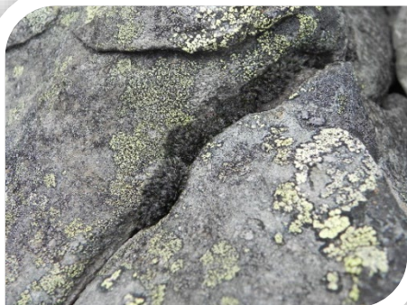
Coscinodon horridus (mousse)

En 2018, une étude des populations de Coscinodon horridus de France – aspects démographique, écologique et reproducteur - a été réalisée par Vincent Hugonnot – Sarl Pépin. L'inventaire de ce taxon exceptionnel, jamais encore signalé pour la France est une découverte de première importance pour la bryologie nationale et départementale.