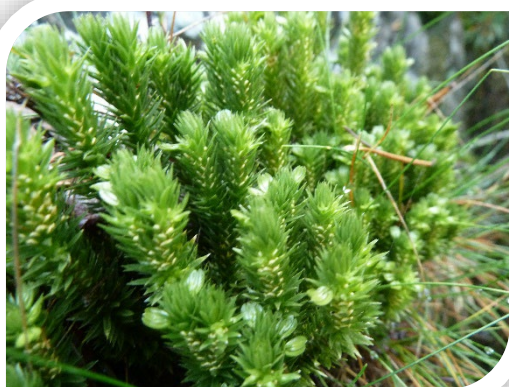
Huperzia selago L. (Lycopode sélagine)