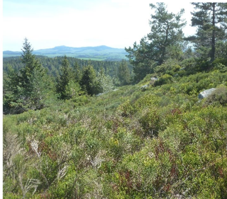
Habitats du Testavoyre

Une identité intimement liée aux espaces naturels d'intérêt européen. La majorité des milieux ou « habitats » sont typiques du Meygal. Ils contribuent significativement à son identité paysagère : une mosaïque de landes, d'éboulis et d'espaces forestiers.