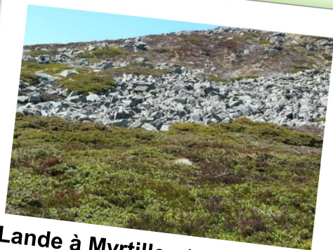
Lande à Myrtille et Callune

Tout propriétaire ou mandataire, qu'il soit une personne physique ou morale, publique ou privée, peut prétendre à la signature de la charte ou d'un contrat.